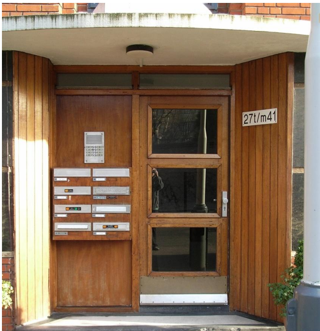
ingangspartij voor renovatie