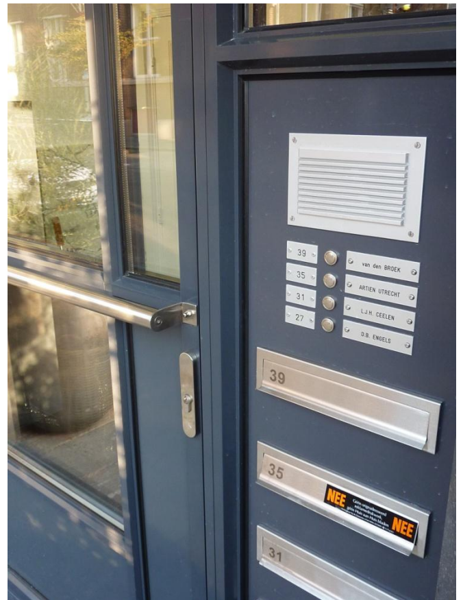
detail nieuwe ingangspartij