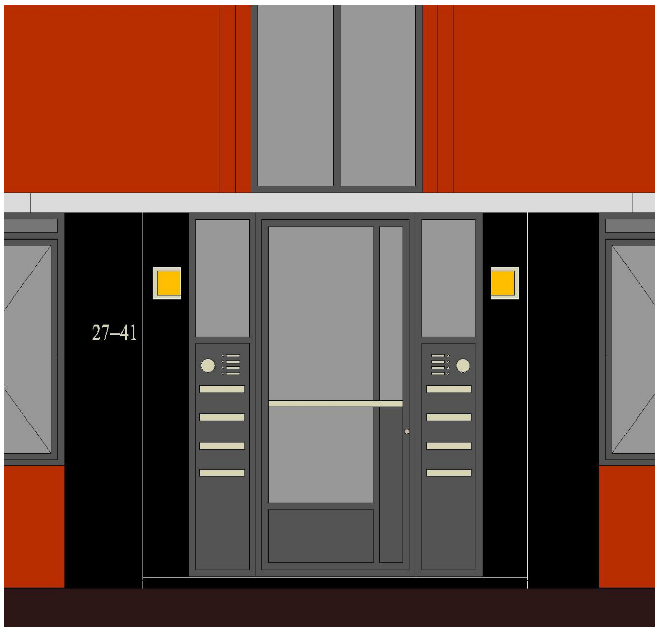
ontwerp nieuwe ingangspartij

Auteur: Ton Hinse stedenbouwkundig onderzoek & ontwerp 20 januari 2010